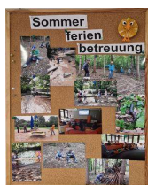
Abbildung 8 Impressionen vom Sommerferienprogramm

Unser Ferienprogramm ist seit vielen Jahren ein fester und beliebter Bestandteil unseres Angebots. Von den insgesamt etwa 14 Ferienwochen im Jahr bieten wir für 7,5 Wochen eine zuverlässige Betreuung an. Dieses Angebot wird von durchschnittlich 45 bis 50 Kindern pro Woche genutzt. Auch einige Kinder von BOSCH-Mitarbeitenden waren in den Ferien regelmäßig dabei. Diese externe Betreuung wird seit einigen Jahren durch eine Kooperation mit der Firma BOSCH finanziell unterstützt.