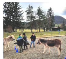
Abbildung 7 Unterwegs mit Eseln auf dem Schwillhof Januar 2025

Unser Projekt „Abenteuer mit Eseln“ startete im Jahr 2024 mit finanzieller Unterstützung des Spendenparlaments (siehe GEA-Artikel vom 09.07.2024, S.12 ). Einmal pro Woche fahren vier Kinder (nach circa 15 Wochen gibt es einen Wechsel) zusammen mit unserer Sozialpädagogin zum Schwillhof in Pfullingen. Dort warten therapeutisch ausgebildete Esel auf die Kinder. Auch andere Tiere vom Schwillhof werden einbezogen, zum Beispiel Hunde, Hühner, Kaninchen und Katzen. Unsere Schulsozialpädagogin arbeitet mit der Methode der „Tiergestützten Pädagogik“. Dabei nutzt sie die positive und einzigartige Wirkung der Tiere bei der Erziehung und Bildung. Die Tiere bieten den Kindern Nähe und Heimat und ermöglichen es ihnen, Verantwortung und Sozialverhalten zu lernen und zu üben.