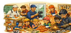
Abbildung 6: Schüler und Handwerker

„Wer will fleißige Handwerker seh'n, der muss zu uns in die Hohbuch-Schule geh'n.“ – Im Rahmen eines Projekts mit der Handwerkskammer Reutlingen besuchen uns einmal im Monat verschiedene Handwerksbetriebe. Lehrlinge, Gesellen und Handwerksmeister zeigen den Kindern die verschiedenen Handwerksarbeiten, beispielsweise in den Bereichen Malerei, Tischlerei, Schlosserei und Fensterbau. Die Schulkinder werden dabei mit einbezogen und erhalten so einen ersten Eindruck von den vielfältigen Möglichkeiten im Handwerk.