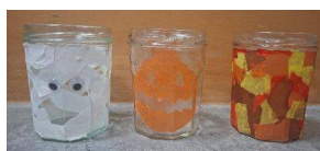
Abbildung 5 Herbstbasteleien

Außerdem laden wir Sie herzlich ein, auf unserer Homepage vorbeizuschauen. Herr Tront dokumentiert dort regelmäßig den aktuellen Stand der Arbeiten und gewährt spannende Einblicke in das Projekt.