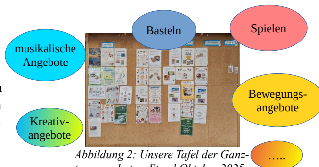
Abbildung 2: Unsere Tafel der Ganztagsangebote – Stand Oktober 2025

Abbildung 2 gibt einen Überblick über unser vielfältiges Ganztagsangebot, das in verschiedene Angebotsgruppen unterteilt ist. Diese Angebote sind bei den Kindern sehr beliebt und werden regelmäßig gut angenommen. Zu Beginn jedes Schulhalbjahres haben die Schülerinnen und Schüler die Möglichkeit, sich für ein Ganztagsangebot anzumelden. Dabei können sie nicht nur aktiv an der Gestaltung der Angebote mitwirken, sondern auch ihre persönlichen Interessen entdecken und weiterentwickeln. So schaffen wir Raum für Kreativität, Gemeinschaft und individuelle Entfaltung.