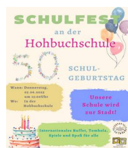
Abbildung 3: Ein Fest zu 50 Jahren Hohbuch-Schule

Das Schulfest zum 50-jährigen Bestehen der Hohbuch-Schule war für uns alle ein ganz besonderes Ereignis. Es wurde Anfang Juni 2025 ausgiebig gefeiert und am 5. Juni 2025 mit einer großen Abschlussfeier gewürdigt. Wir als Förderverein haben uns im Rahmen des Projekts „Schulstadt Hohbuchhausen“ tatkräftig eingebracht. So hat unser „Malerbetrieb“ beispielsweise einige Flächen im Hofbereich der Schule farbig gestaltet.