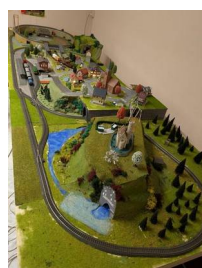
Abbildung 4 Unsere Modelleisenbahnanlage Juli 2025

Mit großer Beständigkeit wird in wechselnder Besetzung und mit großem Engagement an unserer Modelleisenbahnanlage gebaut. Wir sind sehr dankbar, dass Herr Tront die Gruppe fachkundig anleitet und gemeinsam mit den Kindern viele kreative Ideen in die Tat umsetzt. Die Fortschritte dieser Arbeit können Sie gerne im Untergeschoss der Schule bestaunen (siehe Abbildung 4).